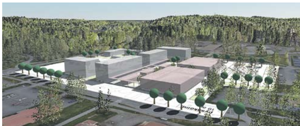
Visio uudesta Huhtakeskuksesta

Uudistamista vaikeuttaa se, että Huhtakeskuksen palvelutilojen omistus on jakautunut useille eri tahoille, mikä tekee päätöksenteosta hankalaa. Virallista tietoa ei vielä ole, mutta vahvojen arvioiden mukaan Keskimaa on ryh-