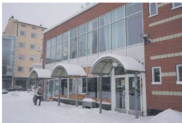
Café Agape sijaitsee vanhassa kauppahallissa.