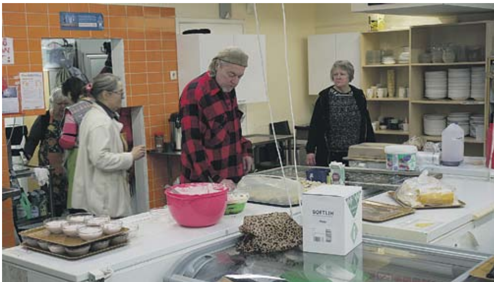
Café Agape tarjoaa torstaisin ilmaista lounasta.

Café Agape vastaa kasvavaan avuntarpeeseen