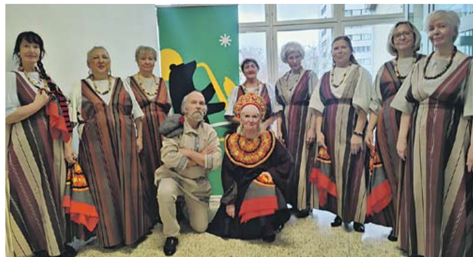
Musiikki yhdistää kulttuurit ja ihmiset. Monikon musiikkiryhmän esiintyjät komeine värikkäine pukuineen.