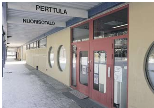
Kirjasto ja nuorisotila halutaan säilyttää.

Huhtakeskuksen uusi suunnitelma oli alustavassa käsittelyssä viime syksynä, ja nyt maaliskuun puolivälissä se etenee asemakaavaehdotuksena viralliseen käsittelyyn. Tavoitteena on luoda nykyaikaiset ja toimivat puitteet alueen palveluille. Kaavan ar-