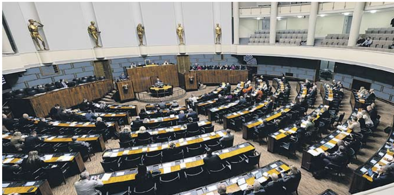
Eduskunnan istuntosali.

Kansanedustaja Jani Kokko on kutsunut Pohjoisen Jyväskylän Sosialidemokraatit ry:n vierailemaan Eduskun-