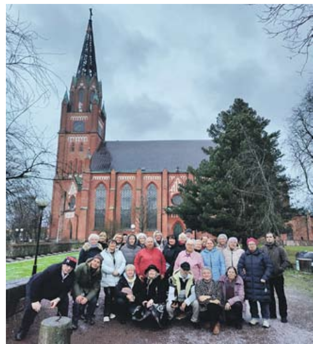
Porin Kulttuurikatselmus -kilpailun esiintyjät ja monikkolaisten kannustusjoukko marraskuussa 2025 Porin kirkon edustalla.

Monikko on aktiivisesti mukana valtakunnallisessa Moi-verkostossa ja paikallisesti MOVE-