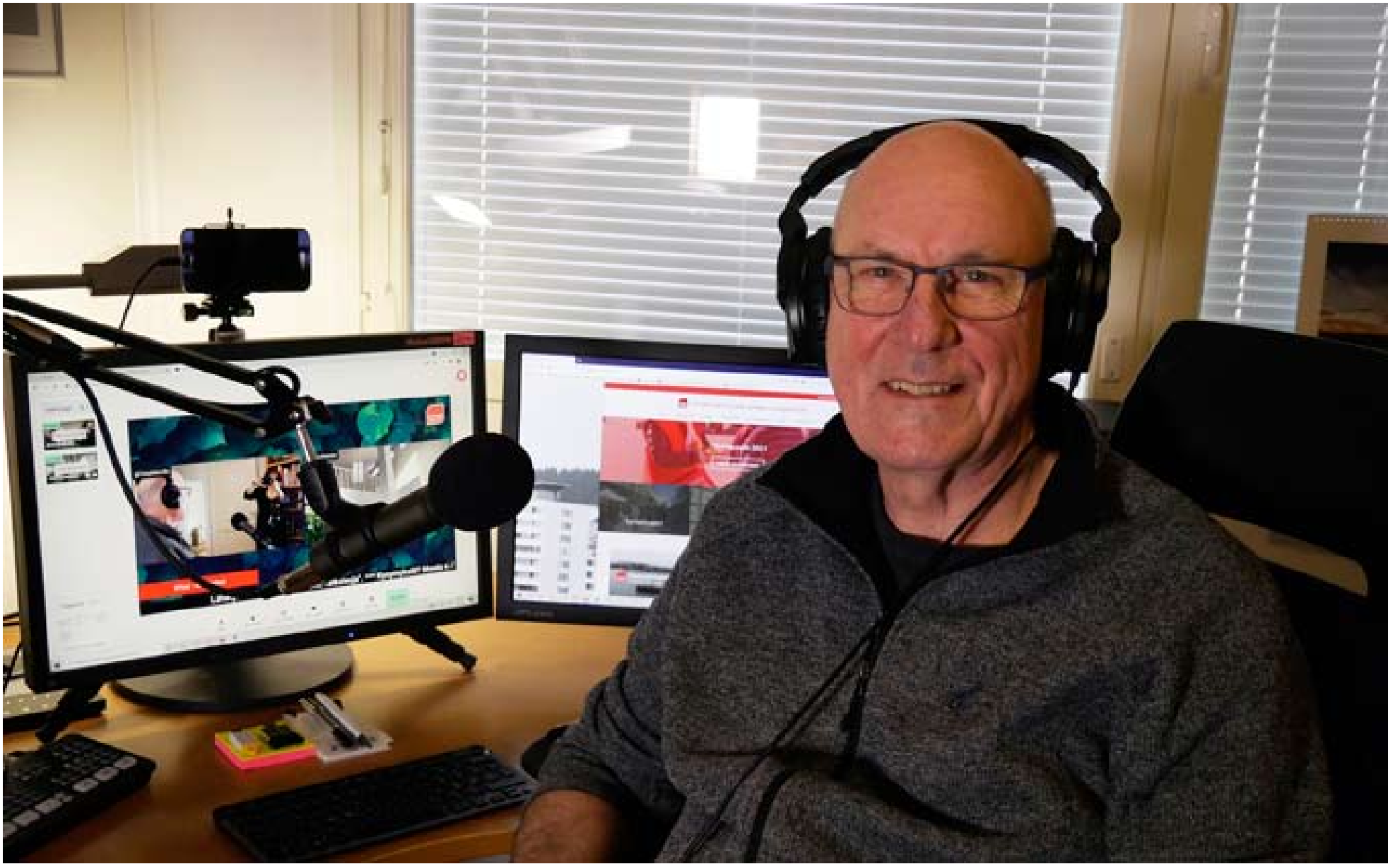
Työhuoneesta on kehittynyt kotistudio.

Vuosikymmenten ajan vaalikampanjointi noudatti tuttua kuviota – katutapahtumia, kokouksia kirjastoissa, kahviloissa ja työväentaloilla, lehti-ilmoituksia ja lentolehtisten jakelua. Vasta 1990-luvun loppupuolella alkoi muutoksen tuuli puhaltaa, kun ensin sähköpostin ja sen jälkeen internetin käyttö yleistyi. Viimeisten kahdenkymmenen vuoden aikana kehityksen vauhti on vain kasvanut. Koronapandemian myötä ollaan ääritilanteessa, jossa kommunikointi kasvokkain äänestäjien kanssa on miltei mahdotonta ja puolueet pitkälti sähköisten ratkaisujen varassa.