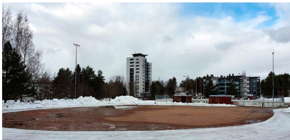
Lohikosken liikuntapuisto. Valaistun kentän tulevaisuus on kysymysmerkki.

Motto: ”Liikuntapaikat kuntoon lähiöissä. Ympäristö huomioitava rakentamisessa. Nuoria on tuettava elämän alkutaipaleella.”