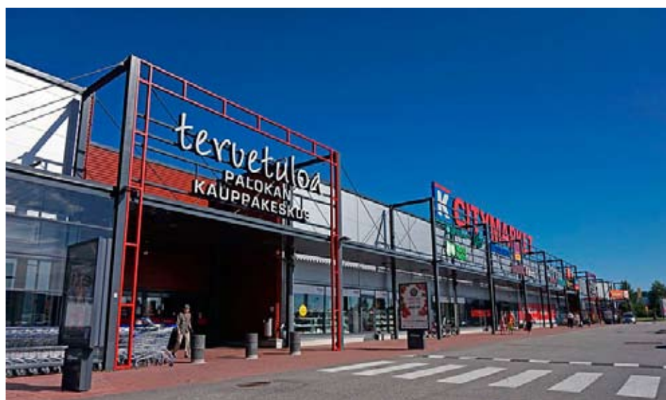
Monipuolinen Kirrin kauppakeskittymä kerää laajalti asiakkaita myös Jyväskylän ulkopuolelta.

Vapaa-aikaan Palokka on ideaali. On puhdasta luontoa, on kolme järven rannat hienoine ympäristöineen. Tourovuoren ulkoilualue sekä Palokan liikuntapuisto tarjoavat erittäin monipuoliset liikunta- ja ulkoilumahdollisuudet. On syytä pitää huolta latuverkosta, luontopoluista, laavuista, nuotiopaikoista. Tarvitaan opasteita ja tuotteistamista, jotta asukkaat löytävät lähellä olevan luonnon kaikkine mah-