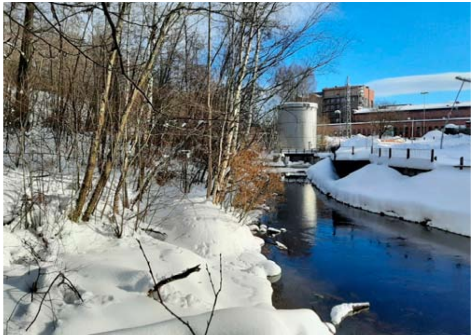
Tourujoen alajuoksu luontopolulta kuvattuna.

Aikoinaan Tourujoki on ollut lohijoki: lohikalat ovat nousseet sitä pitkin kohti pohjoista kutemaan. Tästä kertoo esimerkiksi joen pohjoispäähän rajoittuvan asuinalueen, Lohikosken, nimi. Voimalatoiminnan ja sen jälkeensä jättämien rakenteiden takia kalojen nousu ei ole ollut pitkään aikaan mahdollista.