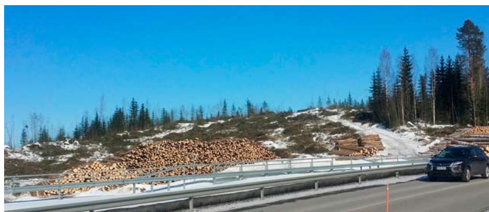
Maisema muuttuu peruuttamattomasti Savulahden kohdalla keväällä 2021. Metsä antaa tilaa rakennuksille.