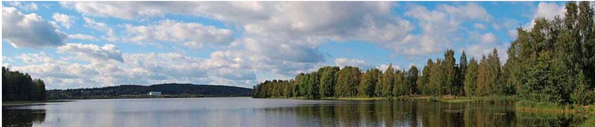
Palokkajärvi on osa kauneinta Jyväskylää. Kuva: Tiia Monto, wikipedia / CC BY-SA 3.0