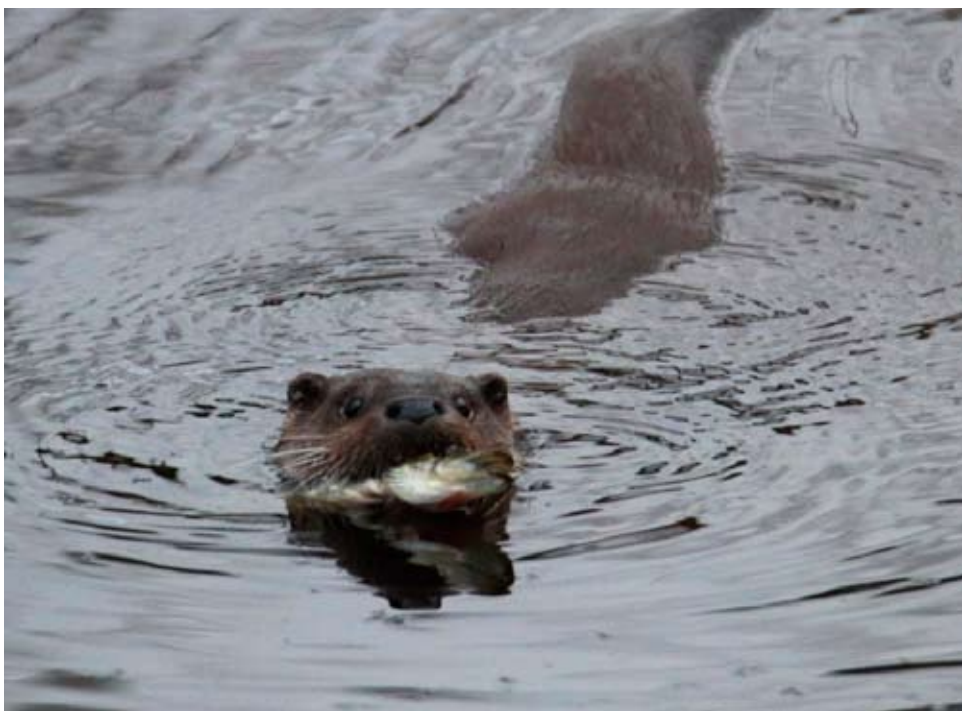
Hyvällä onnella Tourujoella voi törmätä saukkaan.