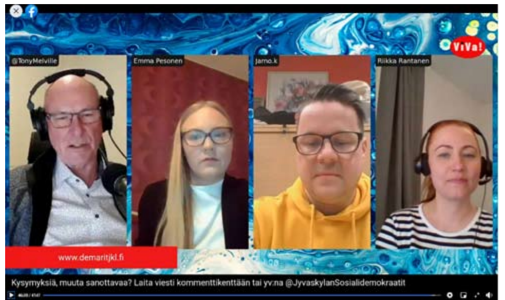
Melon-sovelluksella kuntavaaliehdokkaiden keskustelua voi seurata reaaliajassa ja esittää kysymyksiä esiintyjille.

Läppärillä livestriimi onnistuu kohtuullisesti, mutta monesti vanhas-ta koneesta loppuu puh-ti. Tästä syystä vuonna 2020 tuotiin markkinoille erilaisia selainpohjaisia ratkaisuja, jotka sallivat sekä videoneuvottelua että livestriimausta eri alustoihin.