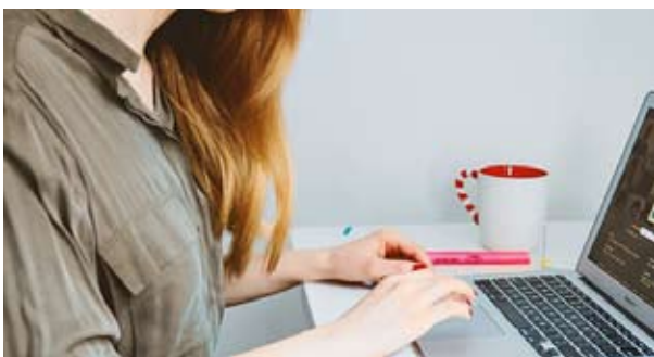
Monikossa etäilläään s. 2