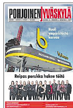
Pohjoinen Jyväskylä 1/2019