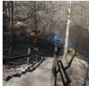
Kuntalaisaloite Kankaanrannan sillasta s. 4