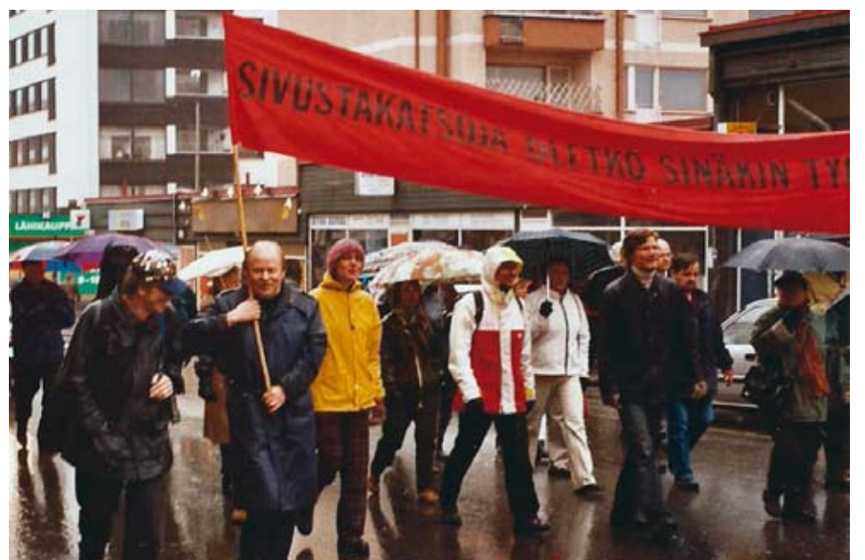
Vappumarssilla Jyväskylässä.

1950-luvulla oli valtakunnan ja paikallisella tasolla useita yrityksiä järjestää yhteinen vappujuhla. SAK kielsi paikallisjärjestöjä ja ammattiosastoja osallistumasta puolueiden vappujuhliin. Muutamat kommunistien johtamat paikallisjärjestöt eivät noudattaneet ohjetta, ja ne erotettiin järjestöstä. 1960-luvulla yhteisen vappujuhlan järjestämisestä käytiin Jyväskylässä useita neuvotteluja. Erittäin aktiivisia olivat SKDL:n johtamat ammattiosastot. Myönteisesti asiaan suhtautuivat myös sosialidemokraattien johtamat ammattiosastot, mutta sosialidemokraattien oli vaikea uskoa ääri-vasemmiston yhteistyöhalun vilpittömiin motiiveihin.