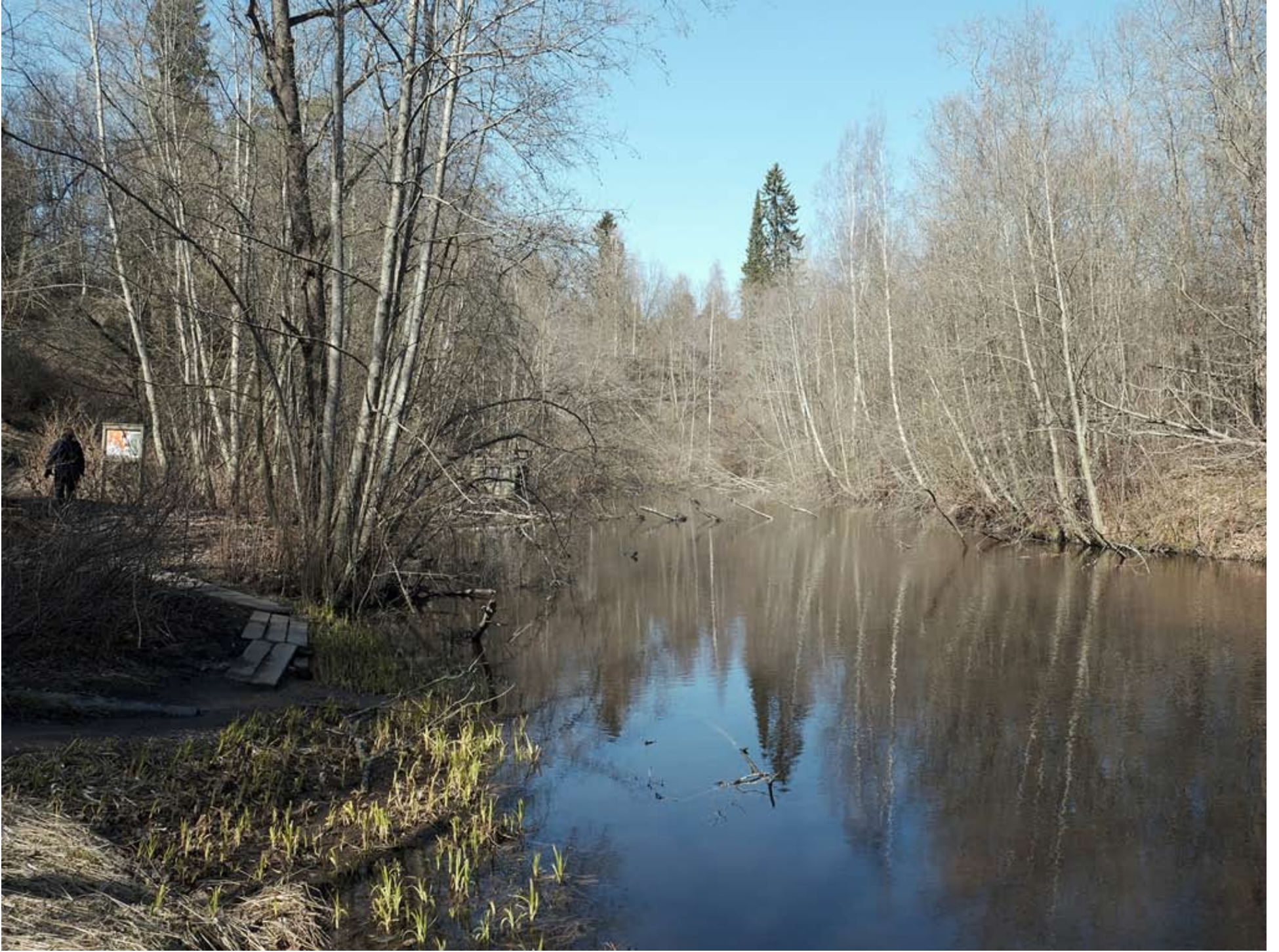
Kankaanrannan silta sijaitsisi juuri vanhan hautausmaan eteläpään kohdalla.