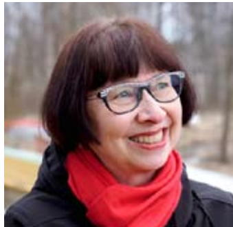
Yritysten avuksi - irtisanomisten välttämiseksi s. 3