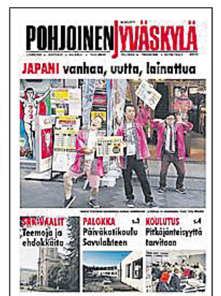
Pohjoinen Jyväskylä 4/2018