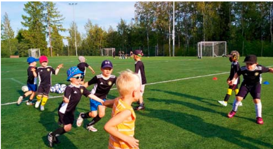
Stadium valioliigassa riittää vauhtia.

Kelta-mustat peliasut ja pörriäislogo palaavat korona- ja kevättauolta jälleen maisemaan. Olen iloinen siitä, että epidemialuvut antavat mahdollisuuden seuratoiminnan käynnistämiseen kohti normaalioloja. Valtioneuvoston määräämät höllennykset tiukkoihin liikkumis- ja kontaktirajoituksiin astuvat voimaan 14.5. ja ne antavat seuralle mahdollisuuden käynnistää pienryhmä-