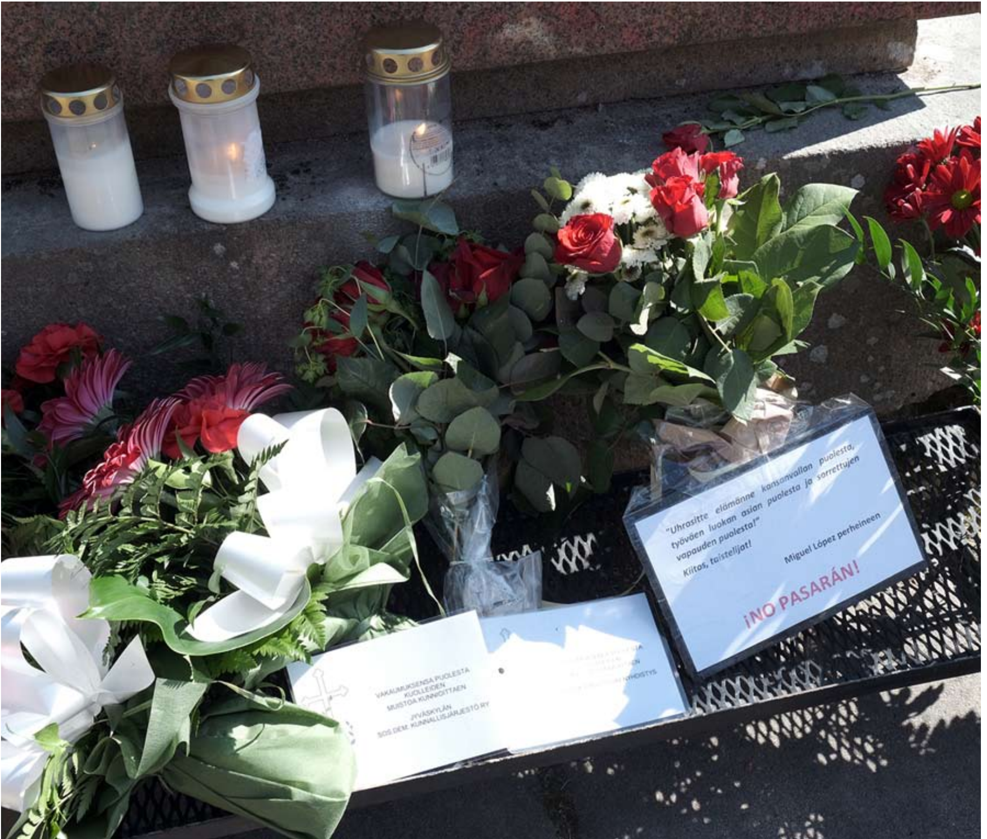
Vappua 2020 vietettiin aivan poikkeuksellisissa tunnelmissa.