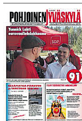
Pohjoinen Jyväskylä EU-vaaliextra

Lue aiemmin ilmestyneitä Pohjoinen Jyväskylä-lehden numeroita verkossa osoitteessa www.pohjoinen-jyvaskyla.fi