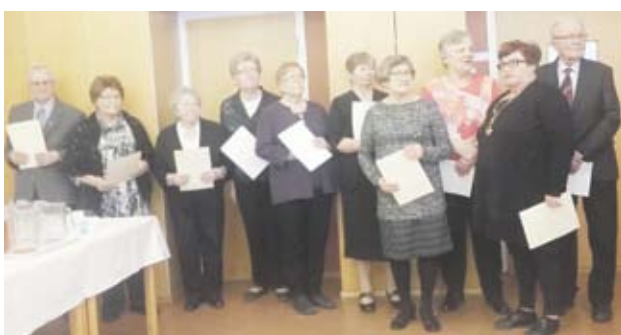
Kunniamerkkien ja kunniakirjojen saajia.