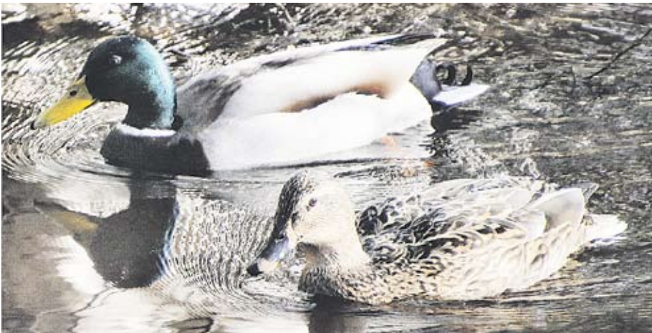
Sini- eli heinäSORSA on periaatteessa muuttolintu, mutta noin viidesosa kannasta talvehtii nykyisin Suomessa. Tourujoellakin tapaa sinisorsia läpi vuoden.

Nyt eletään maaliskuun alkupuolisko, jolloin Keski-Suomessa lintujen kevätmuutto on jo alkanut. Varsinaista muuttoreyntäystä pitää kuitenkin odottaa huhti-toukokuulle, jolloin laji- ja yksilömääräisesti suurimmat joukot muuttolintuja saapuvat Suomeen.