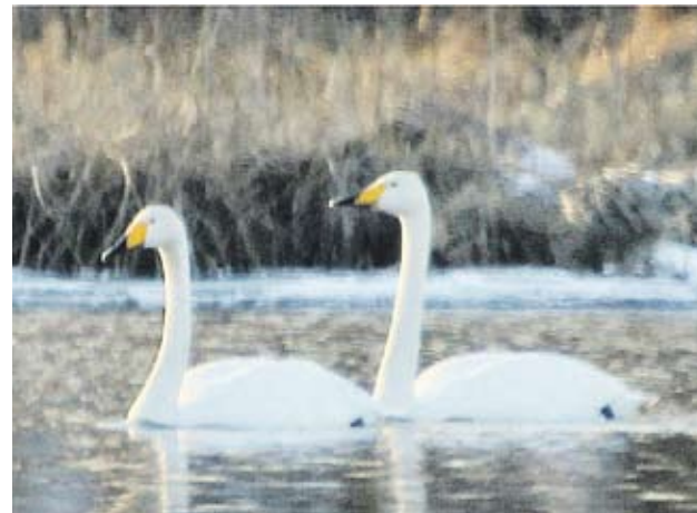
Laulujoutsenpariskunta ilmestyi tänä vuonna Palokkajärvelle Tourujoen suun sulaan jo helmikuussa.

Ilmaston muuttumisen vaikuttaa linnustoon muutenkin kuin aikais- tamalla kevätmuuttoai-