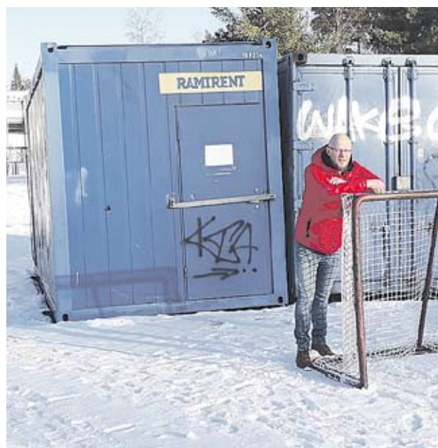
Kontti on vain koululaisten käytössä

Lohikoskella on esitetty lukuisia kertoja Nuoriso- ja asukastilan saamista Lohikosken Liikuntapuistoon. Siellä tulisi olla kokoontumistilat, pukeutumistilat, ja huoltotilat. Tilapalvelu on tehnyt suunnitelman ja kustannusarvion. Esitys