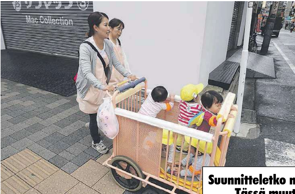
Japanilainen päiväkotiryhmä retkelläkö?

Kun japanilainen lähtee työn jälkeen drinkille paikalliseen krouviin, izakayaan, sääntönä on, että jalojuoma sake kaadetaan aina pöytäseurueessa kaverin lasiin ennen omaa.