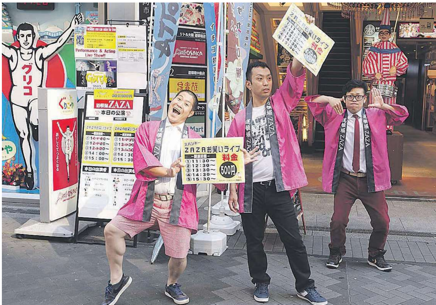
Osakan Dotonbori-ostoskadulla osataan markkinoida - ja keinoja on monenlaisia.