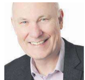
Teksti ja kuvat: Tony Melville Lohikoski

Työpäivän jälkeinen rentoutushetki oluen ja saken parissa.