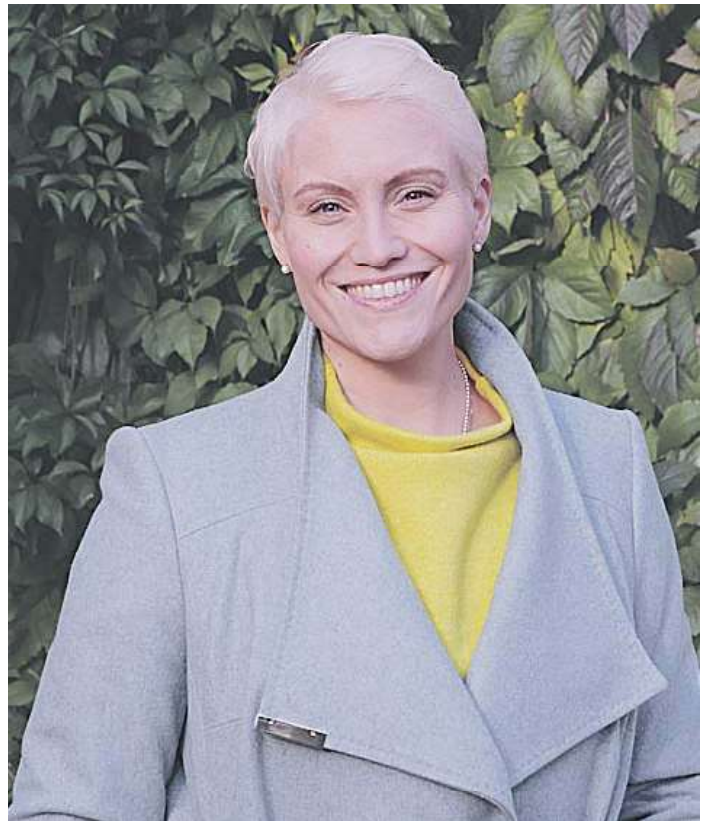
Kansanedustaja Riitta Mäkinen.

Viimeiset viikon Arka-dianmäellä ovat olleet hektisiä. Kireä työmarkkinatilanne on teettänyt töitä.