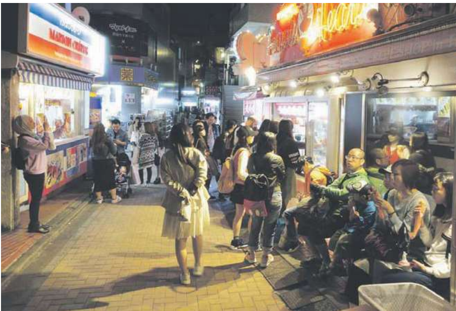
Tokion Harajuku-alue on nuorisokulttuurin sykkivä keskus.

Japani on perinteisesti hyvän järjestyksen ja kohteliaan käytöksen maa; ihmiset jonottavat kuuliaisesti juniin ja busseihin nousemista, syömistä kaduilla karsastetaan, junissa kännykät pysyvät äänettöminä ja jokainen ostos, pieni tai iso, hoidetaan suurella tarkkuudella ja kohteliaisuudella – ja kuitti ostoksesta ojennetaan poikkeuksetta kaksin käsin, kumarrellen. Katukuvasta roskapöntöt puuttuvat; jokainen kuljettaa itse omat roskansa kotiinsa asianmukaisesti hävitettäviksi. Katupysäköintiä ei käytännössä ole ja auton omistus ilmeisesti edellyttää pysäköintipaikan osoittamista omasta pihasta. Koiria toki näkyy, mutta ne eivät saa kävellä vapaasti maassa vaan kulkevat mukana omistajansa kassissa – ei siis koirankakkojakaan missään.