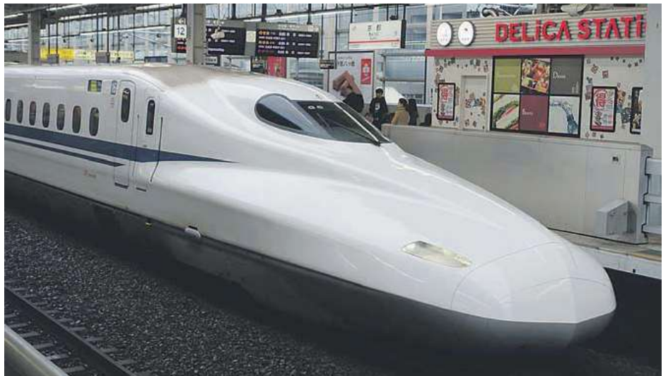
Shinkansen -luotijuna kulkee pääradoilla yli 300 km/t.

Ensinnäkin, on tärkeää ymmärtää maan ja kansan mittakaava. Kolmentuhannen kilometrin mittaisena Japani on kolminkertainen Suomeen nähden ja sen väkiluku, lähes 130 miljoonaa, on kaksinkertainen Britanniaan verrattuna. Suur-Tokion alueella asuu 38 miljoonaa ihmistä ja näin ollen se on maailman väkirikkain metropoli. Japanin pääsaaren etelärannikon megakaupunkien metelin ja vilinän vastapainona on maaseudun seesteisyys ja hiljaisuus. Miltei 75% Japanin pinta-alasta on vuoristoa ja viljelyyn tai asumiseenkin sopimatonta.