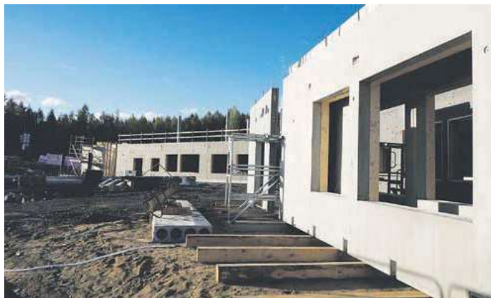
Päiväkoti-koulun rakentamisessa otetaan huomioon terveellinen sisäilma.

Rakentaminen aloitettiin keväällä 2018 ja rakennuksen on kaavailtu olevan valmis käyttöön otettavaksi syyskuudella 2019. Hanke on tarpeellinen Palokan kasvavalle päiväkotikoulunurille.