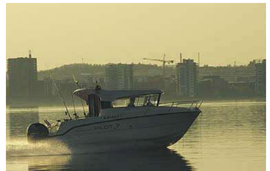
Jyväskyläläisillä on onni asua poikkeuksellisen kauniin luonnon ympäröimänä. Vesistöt antavat mahdollisuuksia monenlaisiin aktiviteetteihin.