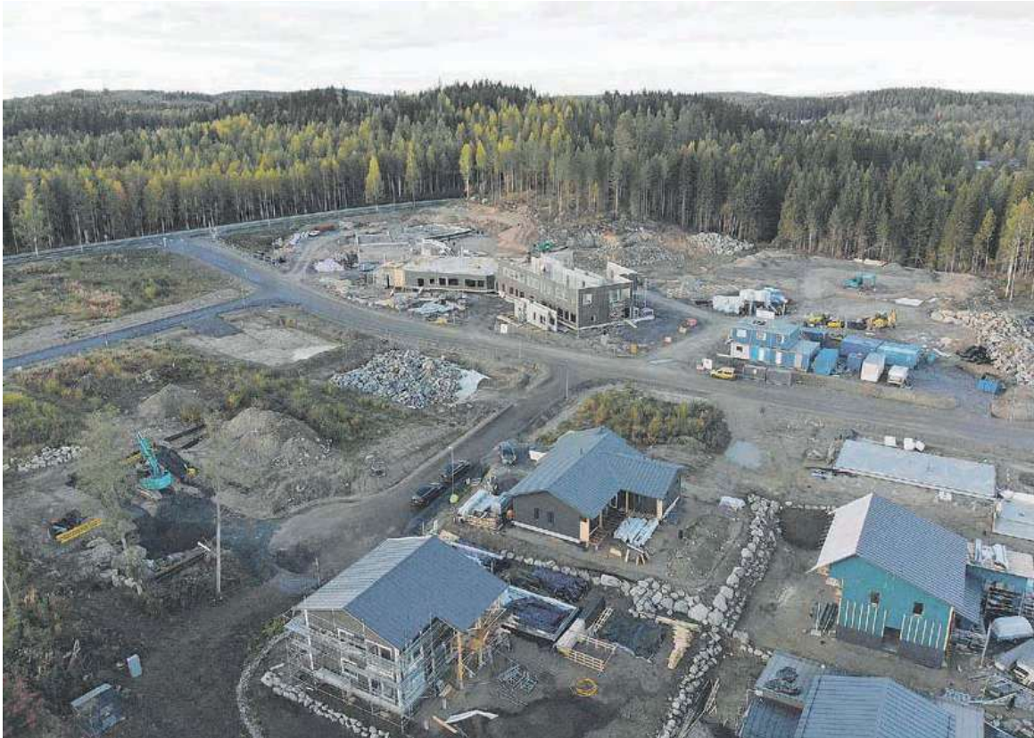
Dronenäkökulma Savulahteen. Alue rakentuu vauhdikkaasti. Päiväkoti-koulu takana vasemmalla.

sijaitsee Palokan kaupunginosassa, Ruokkeen tien varrella, osoitteessa Savulahdentie 1. Savulahteen alue on Tuomiojärven rantamaisemissa. Matkaa keskustaan on noin 6 kilometriä ja Palokan keskustan palvelut ovat noin 2 kilometrin päässä. Alue sijaitsee kävelyetäisyydellä Laajavuoren metsäisistä ulkoilu- ja virkistysalueista. Yhteydet laturi- ja ulkoilureittiverkostoon ovat erinomaiset