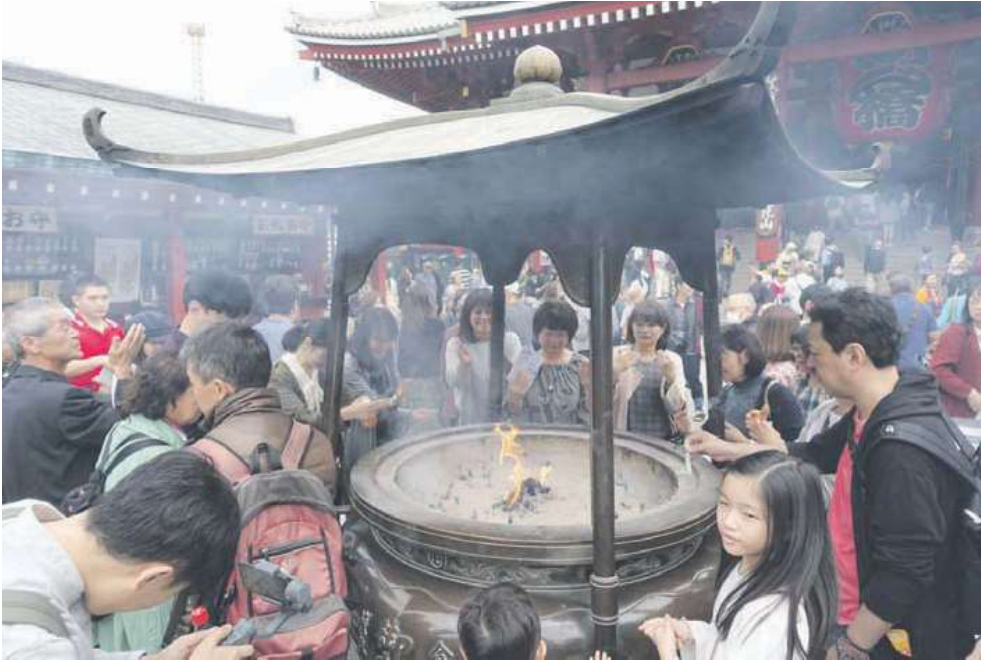
Senso-ji on Tokion vanhin Buddha-temppli. Suitsukkeen savu tuo terveyttä.

Japaniin liittyy epäilemättä enemmän myyttejä ja ennako-olettamuksia kuin mihinkään muuhun maahan. Jotkut pitävät paikkansa, toiset taas ovat auttamattoman väärä – mutta yksi on varmaa, matka Japaniin on edelleen kokemus isolla K:lla.