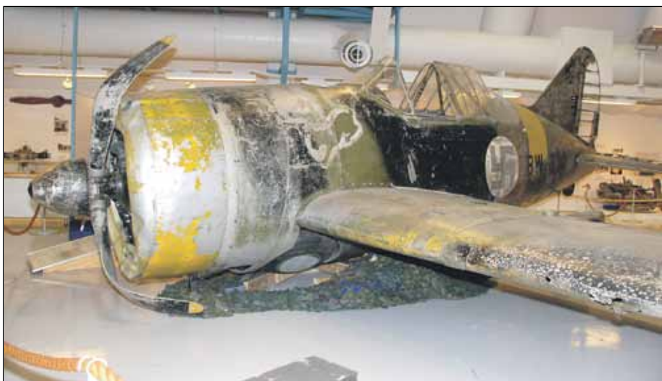
Brewster Model 239, jolla luutnantti Antti Pekuri kävi ilmataistelua.