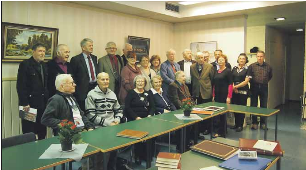
Joukko aikuiseen ikään ehtineitä entisiä Sos-dem. Nuoriso-osastolaisia kokoontui Lohikoskelle tapaamaan vanhoja tuttuja ja juhlimaan. Seuran perustamisesta tuli kuluneeksi 90 vuotta.

Jos nykyään on vaikea saada nuoria mukaan yhdistystoimintaan niin toista se oli ennen. Entiset Lohikosken aktiivinuoret kokoontuivat kotiseudulle muistelemaan menneitä ja tapaamaan vanhoja tuttuja. Juhlaan osallistujia oli eri puolilta Suomea runsaasti vielä vuosikymmenten jälkeen