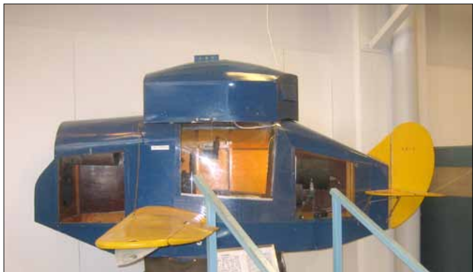
Museon ensimmäinen simulaattori.