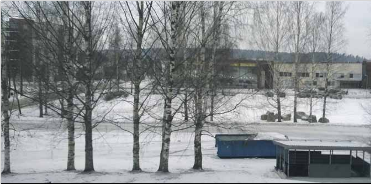
Palokan "seniorikortteli" Koivutien ja Lukutien kulmauksessa.

Uuden kirjaston ja lämpökeskuksen väliin - purettujen rakennusten paikalle Palokan keskeisimmälle paikalle on parhaillaan suunnitellussa "seniorikortteli", johon on tulossa ainakin vuokra-, asumisoikeus- ja omistusasuntoja sekä mm. palvelu- ja terapia-tiloja.