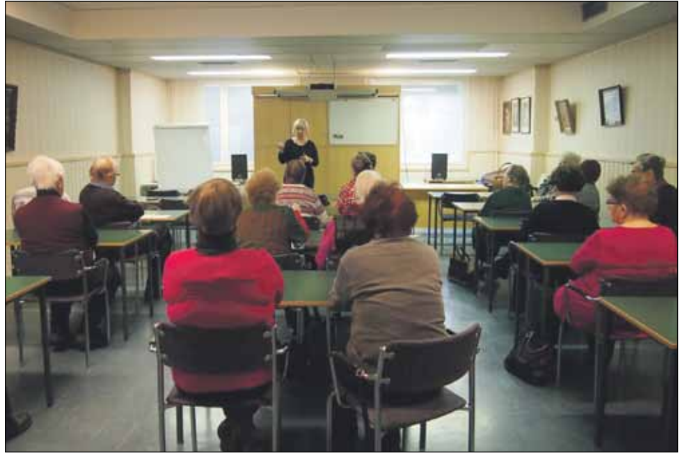
Kansanedustaja Tuula Peltonen vastaili yleisön kysymyksiin.

viemisessä kielitaito on huikea etu. Peltosella on myös kokemusta kansainvälisistä tehtävistä. Hän on niin Euroopan Sosialidemokraattisten Naisten (PES Women) kuin Sosialistisen Naisinternationaalin (SIW) va-