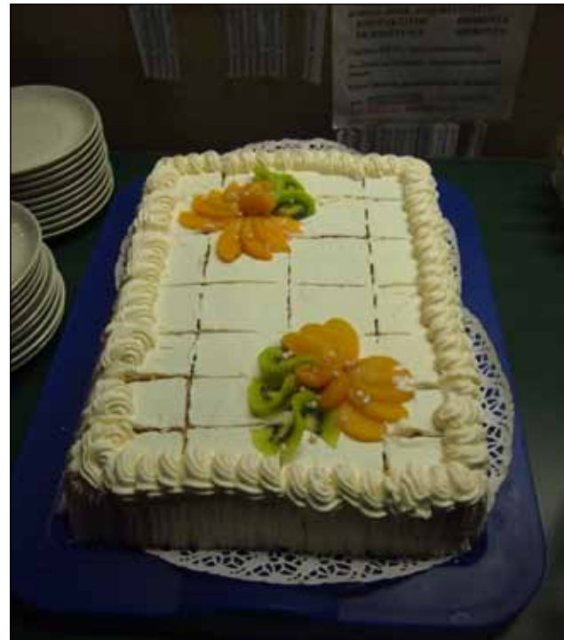
Entiset aktiivinuoret juhlivat Lohikoskella kakkukahvein.

-Kalliorannassa opittiin elämää. Se on erinomainen rikastuttaja vä-