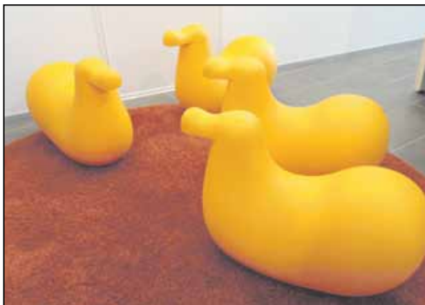
Lastennurkkauksen Dodot pitävät palaveria