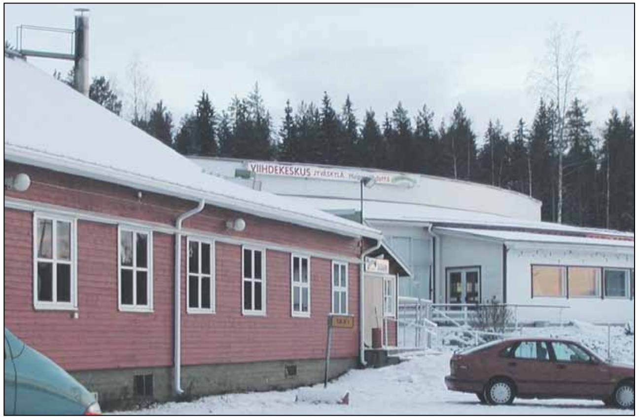
Palokan Viihdekeskus – edessä Hiihtomaja ja takana uudempi tanssipaviljonki.

Julkisuudessa on kerrottu, että yhdistys saa suuret myyntitulot kaavoitettavista tonteista. Huomiotta on kuitenkin jäänyt, että yhdistys joutuu maksamaan tuntuvan kaavoitusmaksun kaupungille, menettää arvottomana tämänhetkisen Viihdekeskuksen rakennukset ja vielä joutuu maksamaan niiden kalliit purkamiskulut jätteenkäsittelymaksuineen. Kiinteistölle omin varoin rakennettu tie sekä vesi- ja viemärijohtot menettävät niin ikään arvonsa. Kun myös menetetty vuokrasopimus otetaan huomioon, menetykset ovat mil-