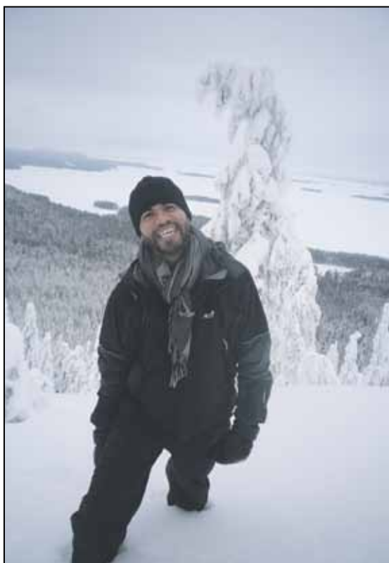
Terveisiä Pohjois-Karjalan vaaramaisemista Kolin kansal- lispuistosta, 16.2.2013.