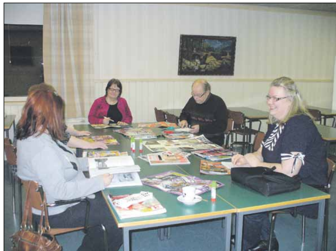
Toimintatupalaisia Aarrekarttojensa äärellä.