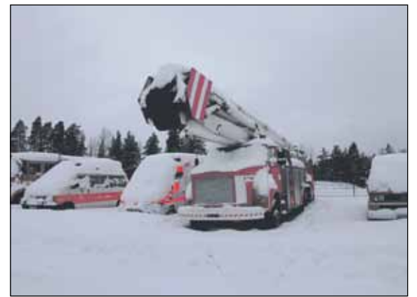
Hälytys ajoneuvojen hautuunmaa sivu 4

Jyväskylällä on vaikeuksia nykyisellään selvittää lakisääteisistä sosiaali- ja terveyspalveluista. Ovathan ihmiset sentään rakennuksia tärkeämpiä.