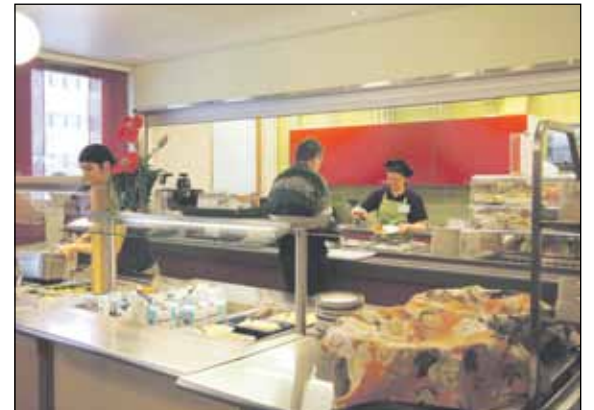
Työttömien ruokalan uudet tilat sivu 5