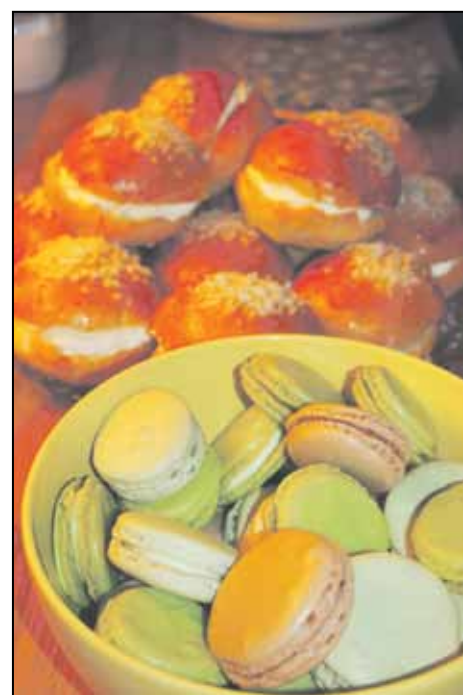
Jokikievarin pitopalvelun leipurit tekevät tilauksesta vaikkapa laskiaispullia ja macaron-leivoksia

Jäsenmäärä on viime aikoina lisääntynyt ja on tällä hetkellä 1322. Yhdistykseen voi liittyä myös kannattajajäseneksi.