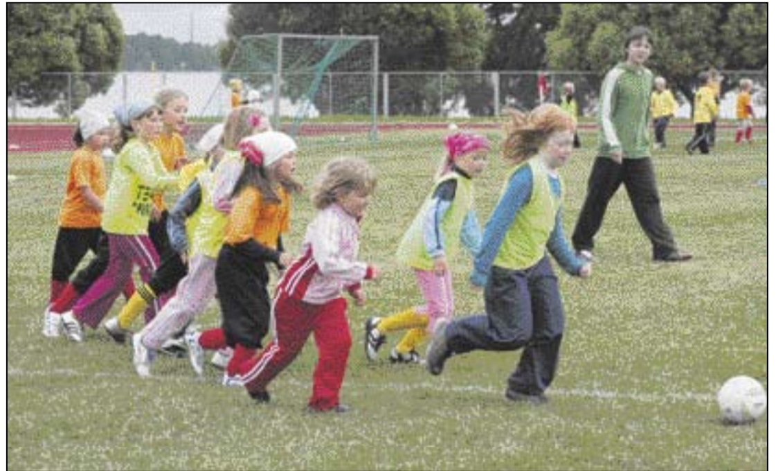
Samanaikaisesti saattaa Palokan kahdella kentällä ja niiden ympäristössä liikkua pallon perässä jopa yli kaksisataa tyttöä ja poikaa. Näin investoinnit tulevat tehokkaaseen käyttöön.

Mutta toisaalta tarjolla on myös enemmän tiloja, esimerkiksi Hippohalli ja Vehkalahden kentät ovat parilaistenkin käytössä. Toivoisimme, että vuorojaossa huomioitaisiin lähiliikuntapaikat ja jokaisessa kaupunginosassa vaikuttavat seurat pystyisivät tarjoamaan riittävän hyvät olosuhteet kodin lähellä erityisesti vasta harrastusta aloitteleville pienimmille nappuloille, Luoma-aho esittää.