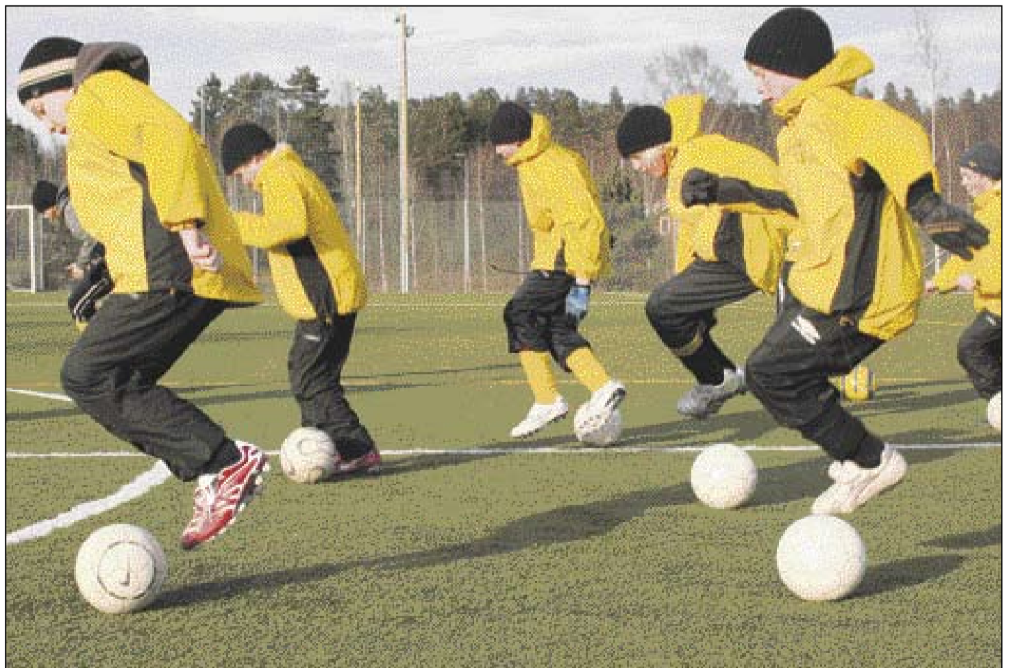
Tekonurmi ei kulu ja sen käyttöaste saadaan korkeaksi. Kausi voidaan aloittaa heti kun lumi saadaan poistettua. Kuva on otettu viime vuoden huhtikuun alussa, jolloin Jyskän kenttää oli käytetty jo reilun kuukauden ajan.